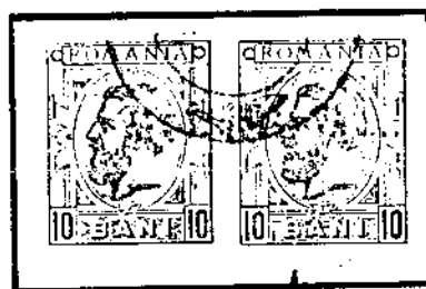
Type II/II, Wz. PR, rot