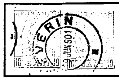
Type I/I, ohne Wz. rot